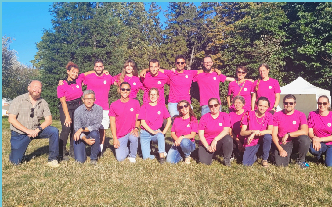
Challenge The Room - Rétrospective 2023

Voici quelques exemple de vidéos (cliquables) que j'ai pu réaliser par le passé : (conception de la vidéo, recherche d'archives, tournage, montage, retouches)