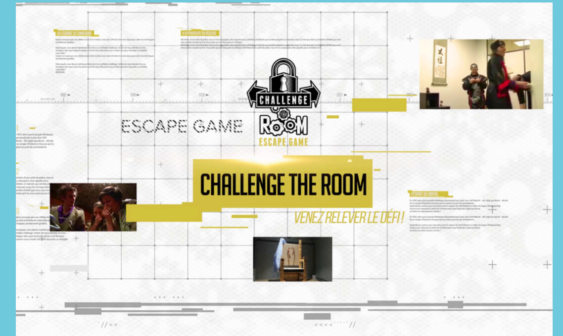
Challenge The Room - Catalogue vidéo de l'entreprise