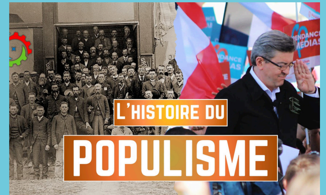
La véritable histoire du populisme