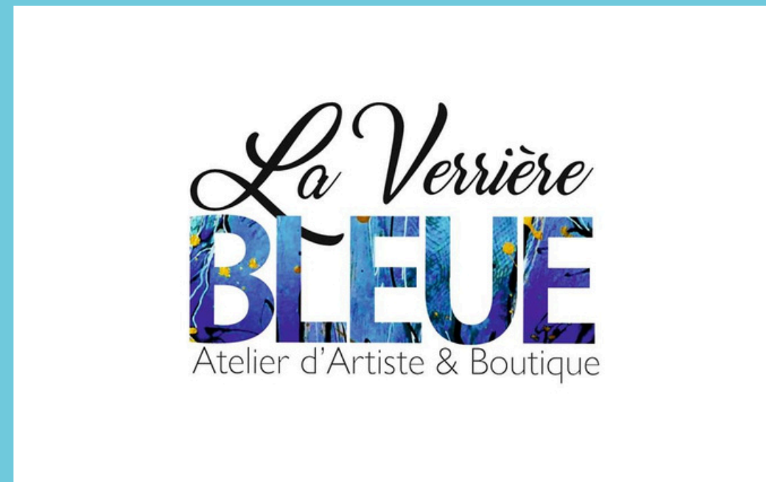
La Verrière bleue - Inauguration cabinet d'artiste