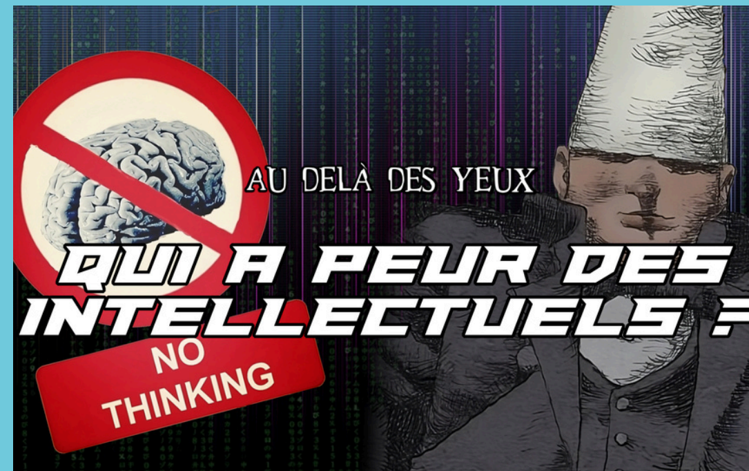
Qu'est-ce que l'anti-intellectualisme ?