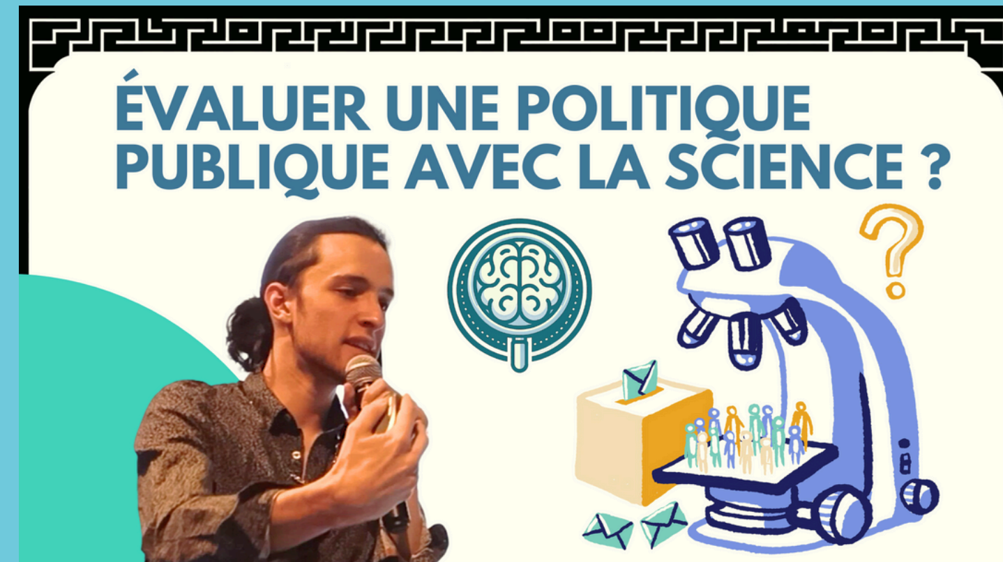
Élaboration d'un univers visuel reconnaissable