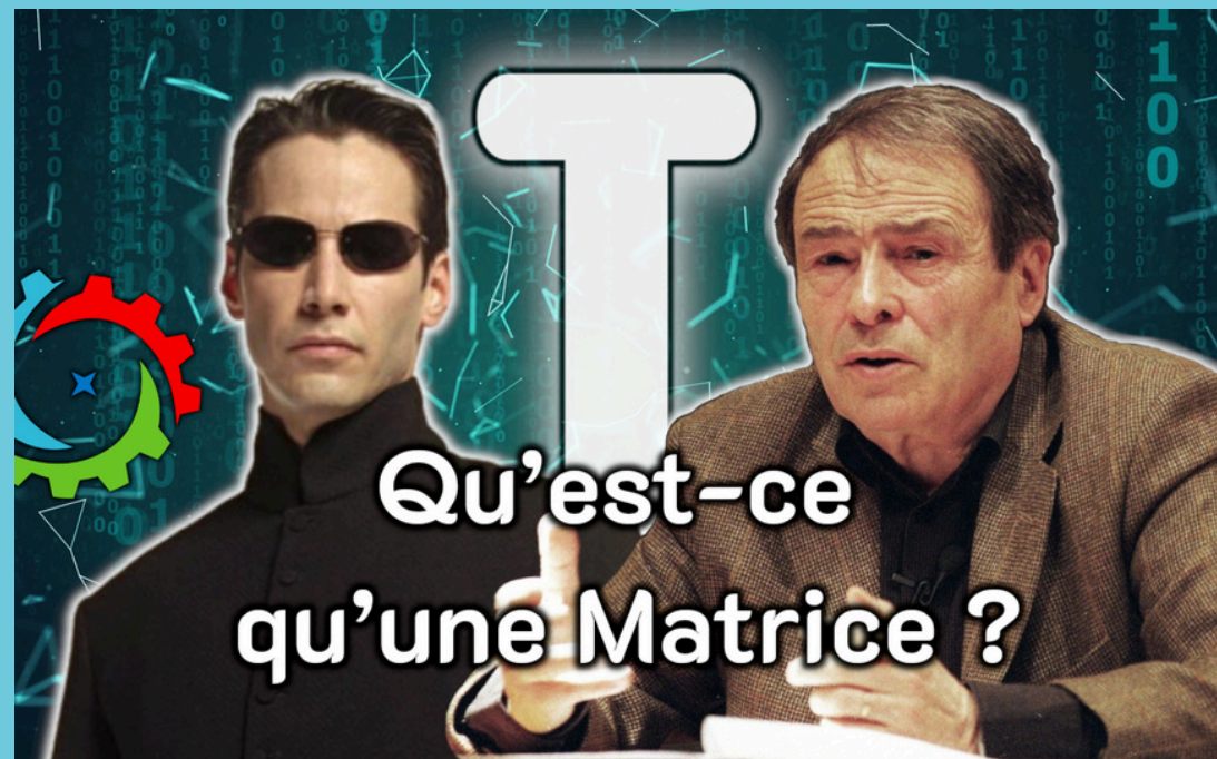
Comprendre Bourdieu par Matrix

Voici quelques exemple de vidéos (cliquables) que j'ai pu réaliser par le passé : (recherche, écriture, tournage, montage, graphisme, publicité RS)